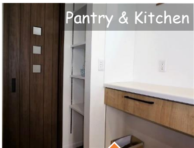
Pantry & Kitchen